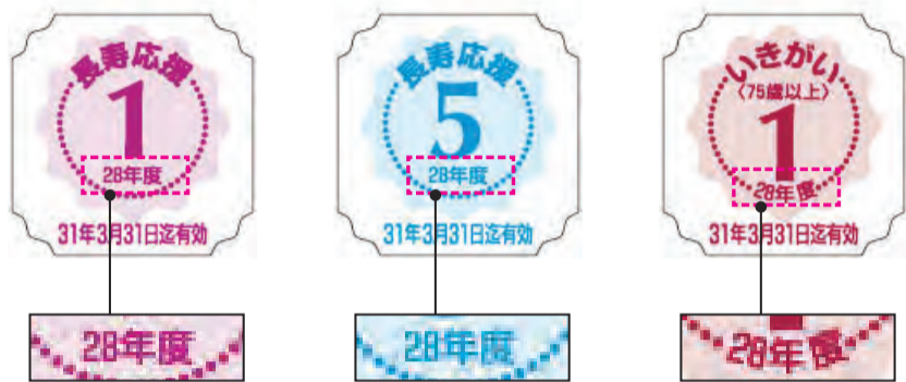
図 高齢者施策課長寿応援ポイント担当

シールに「28年度」と書いてあるものは、31年3月31日が有効期限です。それ以降は交換できません。早めにお近くのゆうゆう館や高齢者施策課（区役所東棟1階10番窓口）で交換申請手続きをしてください。 ※ポイントの交換は25ポイントから申請できます。