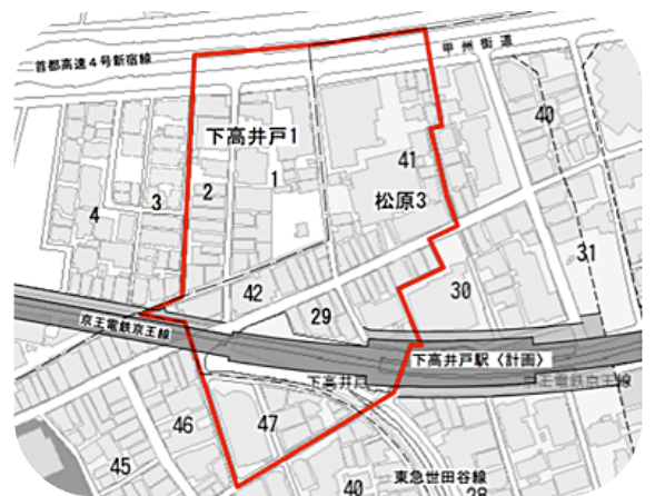
街づくり懇談会の対象範囲

両区でこれらを実現するために、昨年度から右図太枠内に土地・建物をお持ちの地権者の皆様と、街づくり懇談会を開催しています。昨年度は3回にわたり、街の現状や課題についての意見交換などを行いました。