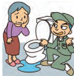
消費者庁イラスト集より

水洗トイレのタンクの水が止まらなくなり、インターネットで検索した業者の広告をみて来訪を依頼した。担当者が一人で来て、「部品を替えなければいけない」と言われ、素人なので金額の妥当性はよく分からず作業を了承した。10分から15分くらいの作業で10万円の請求だった。インターネットで見た広告には「基本料金1,080円～」となっていたのに高すぎると思う。契約書には担当者の手書きで「本人了承済み」と書かれていた。