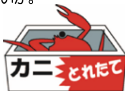
消費者庁イラスト集より

以前に北海道の業者から海産物を何度か購入したことがある。最近、注文していない海産物が送りつけられて困っている。昨夜電話があった時には「〇〇日に届きます」とだけ言って事業者名も名乗らず、聞いても答えなかった。断りたいがどうしたらよいか。