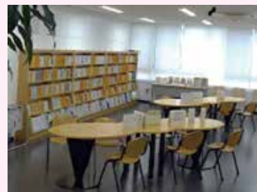
ウェルファーム杉並3階 情報資料コーナー

ウェルファーム杉並3階には、消費者センターが運営する情報資料コーナーがあり、消費生活関連の図書・資料、新聞などが閲覧できます。一部を除いて図書は区内在住、在勤、在学の方に貸出ししています。貸出希望の方は、住所、勤務先（在勤の方）、在学校（在学の方）を証明できる書類をお持ちください。