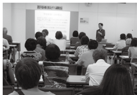
遺伝子組み換え学習会

3人の子どもを持ったことで「食」について考えるようになった父親が監督として「遺伝子組み換え作物— GMO」の実態に迫ったアメリカのドキュメンタリー映画です。上映後、参加者の方々に感想を話し合い、食の安全について考える機会となりました。井草地区区民センター協議会との、当会初めての協働事業でした。