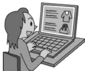
消費者庁イラスト集より

上記以外にもクーリング・オフができない場合がある一方、契約書面の不備などで期間が過ぎていても可能な場合があります。消費者センターにご相談ください。