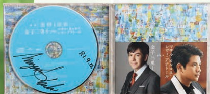
映画『蜜蜂と遠雷』登場人物の一人マサルのピアノ演奏を担当した金子さんのインスパイアード・アルバム