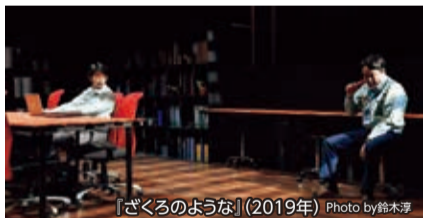
『ざくろのような』(2019年)

「企業の最前線で働く大人たちに観てほしい」。作品を通して共に社会のことを「考えるきっかけにしたい」という思いから、ビジネスをモチーフとした作品を発表しつづけているJACROW。大企業の買収に巻き込まれる人々の姿を描いた昨年の『ざくろのような』に続き、今年は「起業」をテーマに、多様性が求められるこれからの社会を生きる私たちにとってのリアルを描きます。