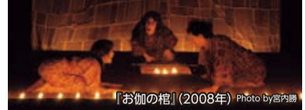
『お伽の棺』(2008年)

機屋で美しい布を織っていたのは、異人の女だったとする扉座版「鶴の恩返し」。鶴を異人と見立てることで、私たちにとっての「境界線」を際立たせます。境界線に阻まれるのか、境界線を越えるのか。照明と音響を使わず、蠟燭の灯りと俳優の