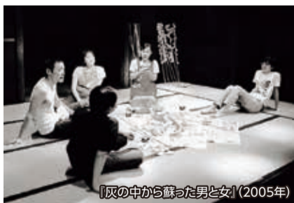
『灰の中から蘇った男と女』(2005年)

老人たちが助け合いながら暮らす山深い集落。ある老夫婦の家に、東京に住む息子の部下という若者が訪ねてきます…。老人たちの柔らかな方言と、若者の言