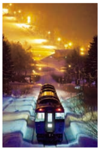
『Winter Express』井上 敏