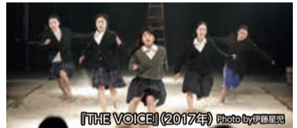
『THE VOICE』(2017年)

大切なひとを失った人々。その悲しみの底から立ち上がらせてくれたのは、亡くなった人の声でした……。映画監督であり、脚本家、演出家の戸田彬弘が、東日本大震災で出会った人々に向き合いながら、フィクションの可能性を問いつけた映画。2017年に舞台化した本作をリメイクしてお届けします。