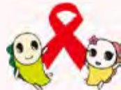
〈東京都のHIV感染新規報告数と梅毒患者報告数〉