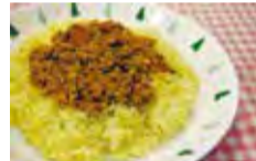
▲大豆入りドライカレーのレシピ