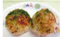
▲たこ焼き風おにぎりのレシピ