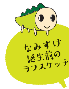
なみすけ誕生前のラフスケッチ

なみすけを20歳の妖精にしたのは、ひとりで杉並にいるという設定なので5歳じゃかわいそうかと(笑)。子どもでも大人でもない、いろいろなことを学びながら素直に生きている生き物にしたかったのかも。仕事がうまく進まないときになみすけを見ると、こういう仕事もしたんだって励まされたり、お母さんになった友人に「親子でファン」と言ってもらえるとうれしくなります。