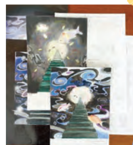
文化祭の原画のアイデアスケッチと完成したポスター

「好きなことを仕事にすると楽しい」という考えの両親で、私がいかに熱心に絵を描くので、父が「デザイナーという仕事があるぞ」って教えてくれて。小学校に入ると、「勉強もした方がいいんじゃないか」と言われるようになったので、ずっと絵を描いていても怒られない大人になるにはどうすればいいかを考えたりしていました。