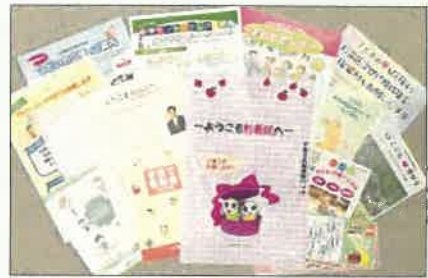
▲子育て支援情報バッグ