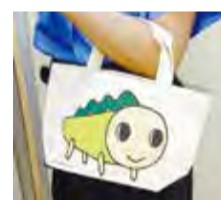
▲キャラトートバッグ