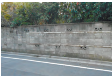
▲改修前 助成対象となったブロック塀