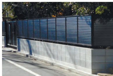
▲改修後 既存ブロック塀を全て撤去し、軽量フェンスに改修