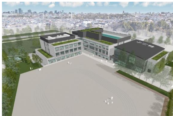
鎌倉街道側からみた校舎▶

改築ニュース第5号、1ページ掲載の鳥瞰図について、日影の表現が実際と異なる部分がありました。修正した鳥瞰図は右のとおりです。訂正しておわびいたします。