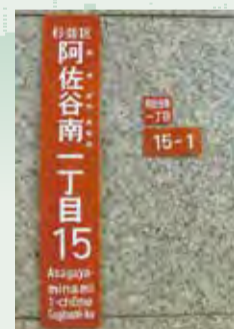
◀町名プレート（右上）、住居番号表示板（右下）、街区表示板（左）