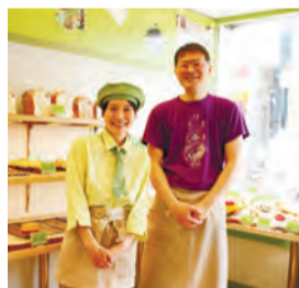
新高円寺 パン屋 boulangerie ECLIN (ブランジェリーエ克蘭) /店長(右)と店員(左)

食品ロス削減のために心掛けていることはありますか 食パンは少人数世帯の方向けに半斤で、バゲットも申し出があれば半分に切って、提供するようにしています。