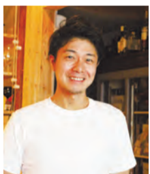
西荻窪 イタリアン CICLO (チクロ) / シェフ

登録したきっかけは何ですか 一生懸命作ったものを残さず食べていただくことは、お店側にとってもお客さんにとっても気持ちがいいことだと思ったからです。