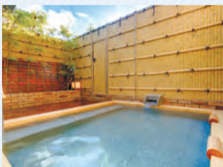
▲湯の里「杉菜」露天風呂

協定旅館 湯の里「杉菜」 神奈川県足柄下郡湯河原町宮上279 甲 電話で、湯の里「杉菜」 ☎0465-62-4805 (午前9時～午後8時)