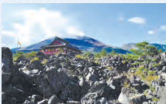
▲群馬県吾妻郡嬬恋村「鬼押し出し園」

阿佐ヶ谷駅南口出発の周遊バスツアーで、話題の「八ッ場ダム」や「鬼押し出し園」、「花寺 吉祥寺」など、施設周辺の定番・人気観光地から穴場スポットまで巡り、ランチは地元民お勧めの人気店で堪能できます。