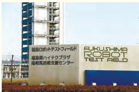
▲南相馬市原町区の「福島ロボットテストフィールド」