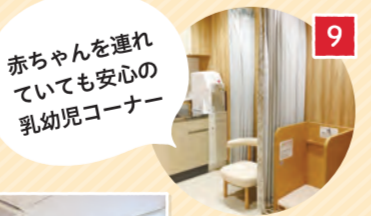
赤ちゃんを連れていても安心の乳幼児コーナー