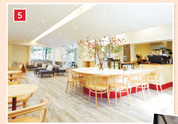
ソファ席でゆったりとしたお茶と読書の時間