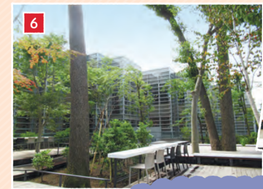
開放感のあるくつろぎの空間!