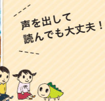
声を出して読んでも大丈夫!