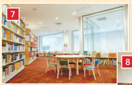
▲「こどもの本」コーナー

児童書のほかに育児書もそろえた「こどもの本」コーナーや、親子で声を出して絵本や紙芝居を楽しめる「おはなしのへや」を設けました。また乳幼児コーナーには調乳用給湯器、授乳室、幼児トイレを用意しています。