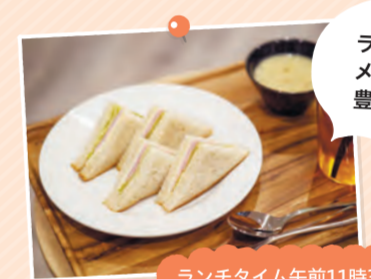
ランチメニューも豊富です!