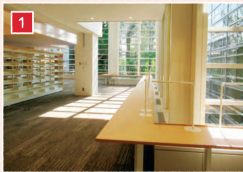
明るく開放感のある窓際のカウンター席

閲覧席を大幅に増設するとともに、窓際には眺めの良いカウンター席を設けるなど、読書や学習などに適した空間を作りました。