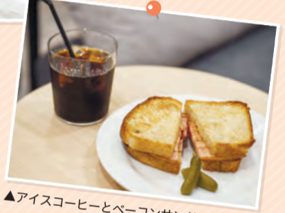
▲アイスコーヒーとベーコンサンドイッチ