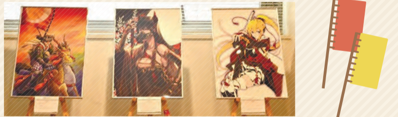
▲今年6月の武者絵展の様子

時 10月26日(月)～11月6日(金)午前8時30分～午後5時(土・日曜日、祝日を除く) 場 区役所2階区民ギャラリー 園 文化・交流課交流担当