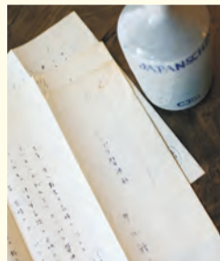
▲コンブラ醤油瓶と原稿

…………… いずれも …………… 場 郷土博物館(大宮1-20-8) ☎3317-0841 費 100円(観覧料。中学生以下無料) 他 月曜日、毎月第3木曜日(祝日の場合は翌日)は休館