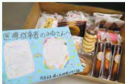
▲区立小学校児童からの応援メッセージを添えたお菓子