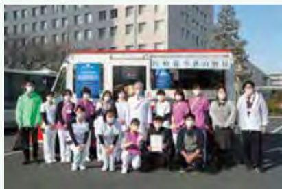
▲佼成病院にキッチンカーを手配し、セットランチを提供しました