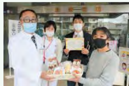
▲区内障害者施設職員から荻窪病院に応援メッセージとお菓子を届けました