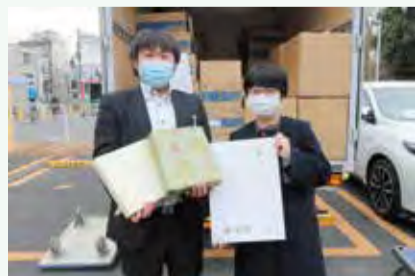
▲河北総合病院に区長からのメッセージとお菓子を届けました