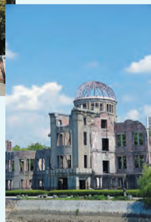
▲原爆ドーム