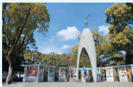
▲広島平和記念公園

時8月5日(休)～7日(土)(2泊3日) 対現地の中高生との交流、被爆体験講話、平和記念式典参列、灯笼流し、広島平和記念資料館の施設見学ほか 対区内在住の中学2・3年生(中学生海外留学・中学生小笠原自然体験交流に参加経験のある生徒は参加不可) 定30名(申し込み多数の場合は、志望動機等を考慮の上、決定) 費区役所までの交通費ほか 申区立中学校の生徒=応募用紙(各学校で配布)を、各学校が決める締め切り日までに担任へ提出▶区立中学校以外の生徒=応募用紙(区ホームページから取り出せます)を、4月23日午後5時(必着)までに区民生活部管理課庶務係(区役所西棟7階)へ郵送・持参 他アレルギーやぜんそく等の個別対応はできません。氏名・学校名・活動中の写真等を区ホームページ・広報紙等の刊行物へ掲載することがあります