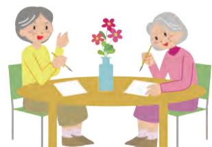
………… いずれも ……