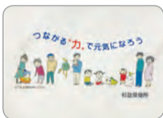
◀サコッシュデザイン