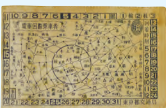
都電杉並線 電車回数券 昭和18年10月

「中島飛行機」「杉並の昔（昭和30年代ごろまで）」について情報をお持ちの方は展示会場ヒアリングコーナーに資料や写真を持参してください。スタッフが話を伺います（期間中午後2時~4時30分〈6日は4時まで〉）。