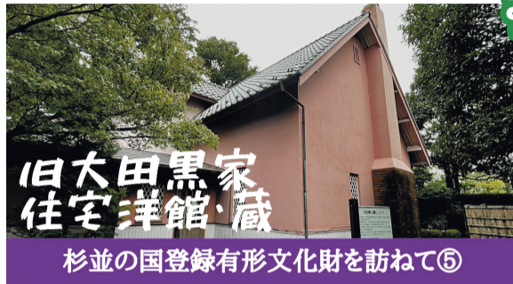
杉並区広報番組 すぎなみスタイル

歴史的価値のある建造物を後世に残すための国登録有形文化財。杉並区内にも20以上の国登録有形文化財があります。今回はその中から、かつて荻窪に多く見られたという洋館のたたずまいを今に残す、旧大田黒家住宅を紹介し