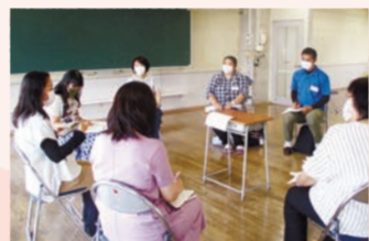
地域懇談会の様子▲

ります。特にコロナ禍での保育はどの園もさまざまな制約や配慮が求められますが、そうした中でも日々の保育や行事について見直しや工夫をしていることが分かり、とても有意義な会になりました。今後も「地域懇談会」では、それぞれの園の特徴や個性を尊重して共に学び合う関係を築き、どの園に子どもを預けても「質の高い保育」が受けられる環境の整備に貢献していきたいと思っています。