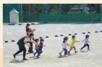
旧杉並第四小学校の校庭▲

ら近隣の保育園が交代制で利用する取り組みを開始しました。旧杉並第四小学校には自然園もあり、ザリガニやカメがいて、子どもにはワクワクする空間です。保育士からも、毎週決まった場所を利用できるので、保育の実践が継続できるとの声もあり、順調なスタートが切れました。この取り組みによる繋がりを生かして、コロナの収束後は他の保育園の園庭の共同利用も広げていきたいです。