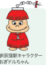
JR荻窪駅キャラクター おぎドルちゃん

—— 問い合わせは、JR荻窪駅改札口へ直接、産業振興センター 観光係 ☎5347-9184へ。