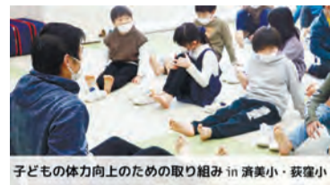
子どもの体力向上のための取り組み in 済美小・荻窪小