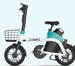
▲電動アシスト自転車/Luup