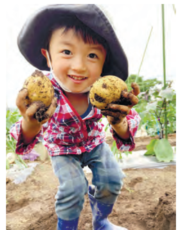
▲昨年度の農業委員会会長賞作品

☎「杉並の農風景」に係る写真 ▶ 大きさ = 六ツ切(A4サイズの印画紙に印刷した写真でも可) ▶ 賞 = 農業委員会会長賞1名(賞状、区内共通商品券5000円分)、入選5名(区内共通商品券2000円分)、佳作10名(区内共通商品券1000円分) ▶ 入賞者発表 = 11月上旬(予定) ☎区内在住・在勤・在学の個人または団体 ☎作品の裏面に住所・氏名・電話番号・タイトルを書いて、10月7日までに杉並区農業委員会(〒167-0043上荻1-2-1Daiwa荻窪タワー2階産業振興センター都市農業係内)へ郵送・持参 ☎同係 ☎5347-9136 ☎1人2点まで。個人を特定できる場合は、事前に写っている人の承諾が必要。入賞作品はデータ等の提出をお願いするなど、杉並の農業振興に関するイベント等に利用する場合あり