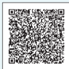
▲申し込みフォーム