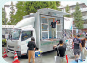
起震車体験の様子