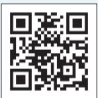
▲杉並区スポーツ振興財団ホームページ