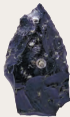
▲旧石器時代の尖頭器(黒曜石 長さ2.5cm)