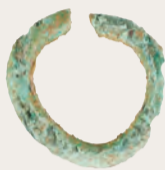
▲【区内初出土】古墳時代の耳飾り(径1.5cm)