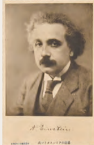
▲アインシュタイン直筆サイン入り葉書