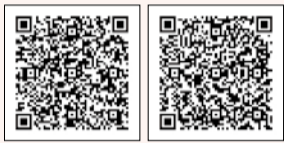
▲認可保育所 ▲区立子供園