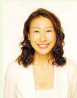
杉並区長 岸本 聡子

場 区役所第3・4委員会室(中棟5階) 対 区内在住で18歳以上の方 定 20名程度 申 はがき・Eメール(12面記入例)にテーマに関する意見も書いて、区政相談課 ☎sodan-k@city.suginami.lg.jp。またはLoGoフォーム(右2次元コード)から申し込み/申込締め切り日=10月12日