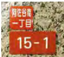
▲住居表示板(下)、町名プレート(上)

住居番号表示板(縦6cm×横12cm程度の横書き)は、住居表示を明らかにするため、各戸の出入り口付近に貼り付ける表示板です。表示板の文字が読みづらい、表示板がないという方に、新しいものをお渡しします。また、町名を表示した町名プレート(縦6cm×横6cm)も、希望する方にお渡しします。