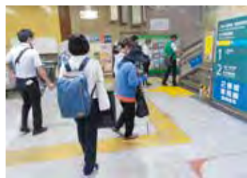
▲荻窪駅で実施したまち歩き点検の様子

区市町村による「移動等円滑化促進方針」策定の努力義務化や、より一層の「心のバリアフリー」の推進を盛り込んだ改正バリアフリー法が施行されたことなどを背景として、誰もが気軽に利用でき、移動しやすいまちの実現に向け、「杉並区バリアフリー基本構想」を改定します。