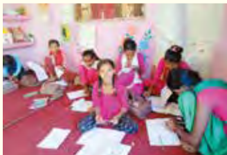
▲ネパール寺子屋

回収品目=書き損じはがき、未使用の切手・プリペイドカード等 ▶ 回収期間=3月20日(月)まで ▶ 回収場所=区役所1階ロビー、図書館、地域区民センター（高円寺を除く）、区民事務所 ▶ 郵送=杉並ユネスコ協会事務局（〒167-0043上荻2-34-10山田正方） 同事務局・山田 ☎090-6105-6633 郵送は随時受け付け