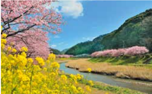
▲南伊豆町 みなみの桜と菜の花まつり