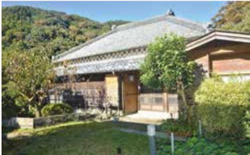
▲上賀茂 田舎暮らし体験住宅