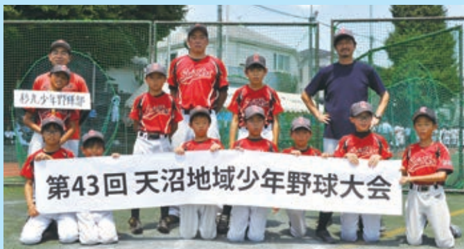
小学生の部 優勝 杉九少年野球部