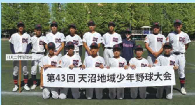
中学生の部 優勝 日大二中B