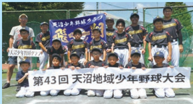
小学生の部 準優勝 天沼少年野球クラブ