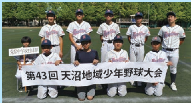
中学生の部 準優勝 東原中