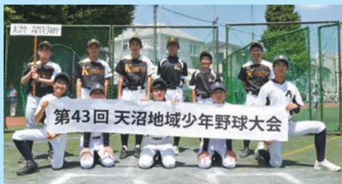
天沼中・高円寺学園中