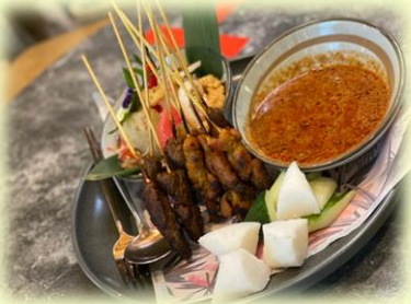
～ マレーシアの焼き鳥 ～