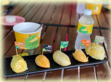
～ ドリアンの食べ比べ ～