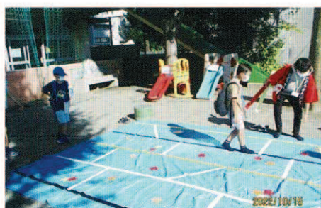
みやまえ秋のなぞときウォークラリー