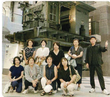
←ニュースパークのシンボル新聞を印刷する輪転機前にて