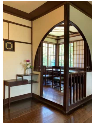
写真8 「本屋」内観・居室から食事室を望む