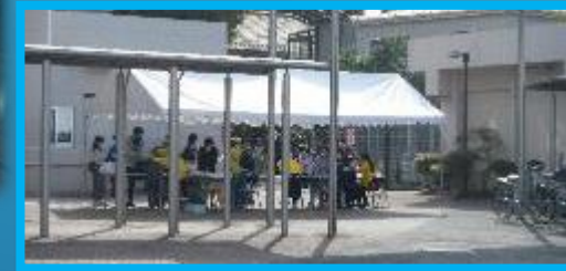
地域の皆さんが支えています。(受付) →

体育館では、24のお店が軒を連ねました。この日のために準備を進めてきた児童・生徒の表情はとても明るく、また、それをそっと支援する地域や保護者の皆さんもとても楽しそうに活動をしていました。手作りの景品やこだわりのゲームなどとても盛りだくさんでした。校舎内やピロティにもお店が開かれ、どこも賑わいを見せていました。事前予約の3部入替制のため、混雑、混乱もなくスムーズに回ることができました。