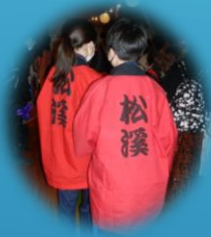
↓縁日の雰囲気を感じられ、とてもわくわくします。