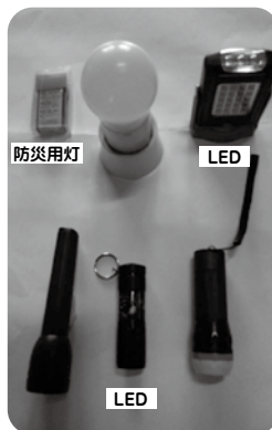
準備した懐中電灯