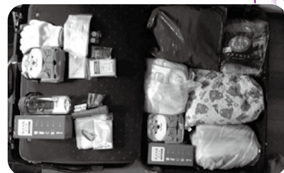
持ち出し用キャリアケース