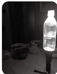
ペットボトルランタン

●警視庁がHPで紹介していた懐中電灯の上にペットボトルを置いた「ペットボトルランタン」を夜試しました。とても明るく、おすすめです。