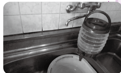
折り畳み式ポリタンク

●食事はお皿が汚れないようにラップを敷いたり、ワンプレート料理にしたり、節水を心がけました。