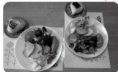
ワンプレート料理