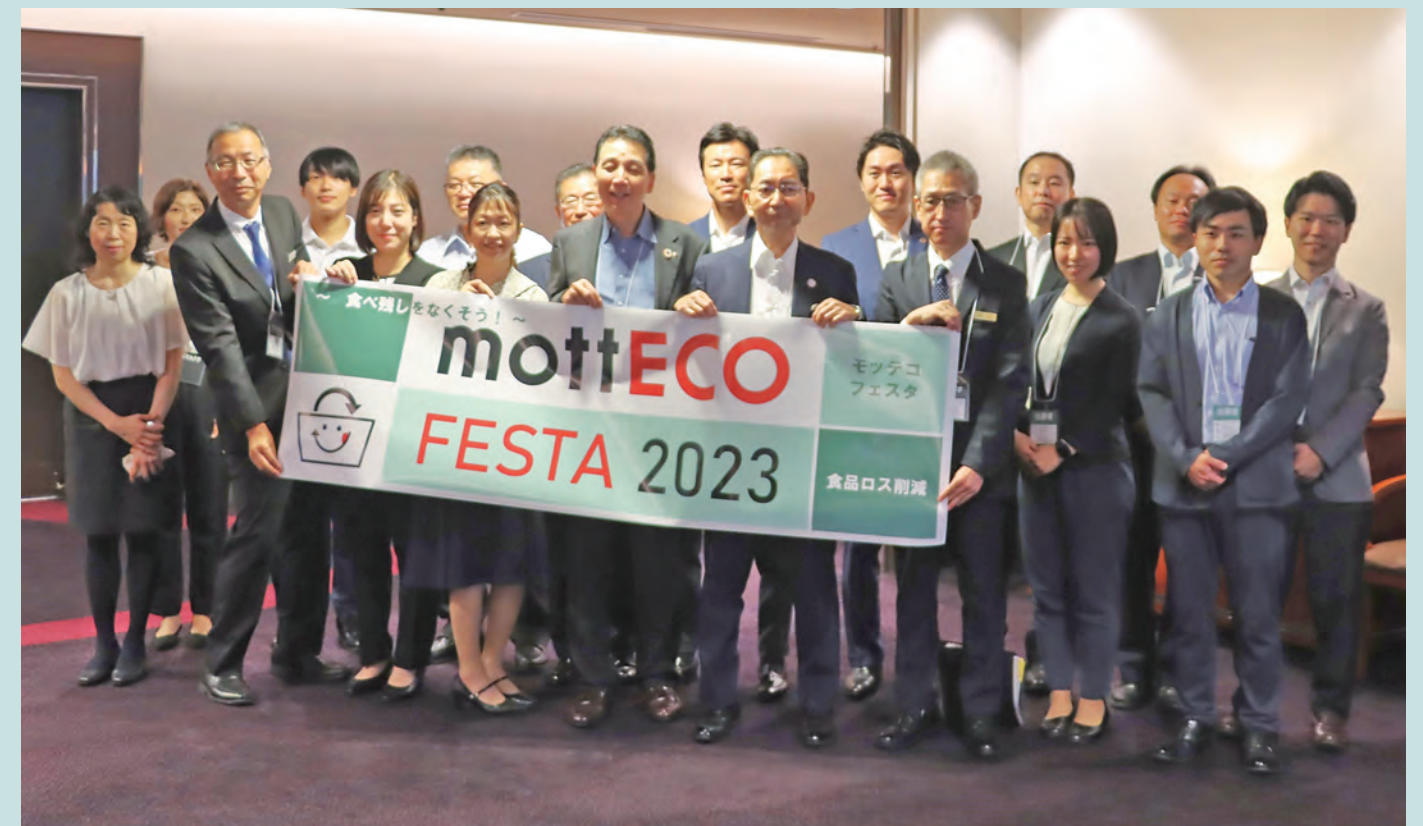
mottECO FESTA 2023 コンソーシアムメンバー

7月24日(月)に『mottECO FESTA2023』を開催しました! 区は事業者と共に、「mottECO」の文化を広めていけるよう、新たな取組にチャレンジします!