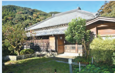
▲上賀茂・田舎暮らし体験住宅

時6月25日(日)午後2時～4時 場 区役所第5・6会議室(西棟6階) 対区内在住・在勤・在学の方 定20名(抽選) 申 関東京共同電子申請・届出サービス(下2次元コード)から申し込み。または電話で、文化・交流課交流推進担当 電3312-9415/申込期限=6月19日 他 結果は6月22日までに通知。南伊豆町担当者との個別相談あり