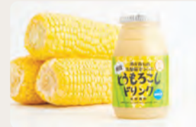
▶忍野村の「とうもろこしドリンク」