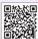
▲高齢者安心コール