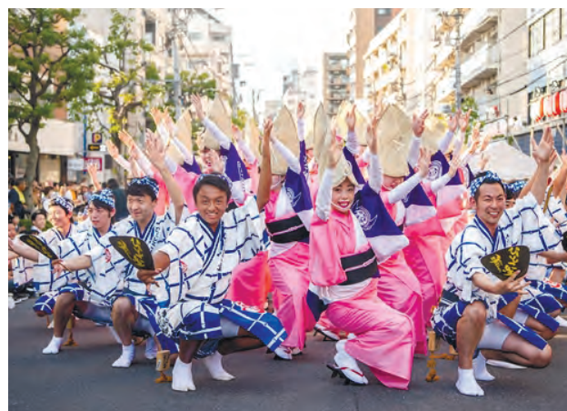
◎東京高円寺阿波おどり振興協会

8月26日(土)・27日(日)に「東京高円寺阿波おどり」の屋外演舞を4年ぶりに開催します。祭りの発祥は、昭和32年に商店街の記念行事で38名が踊った「高円寺ばか踊り」。コロナ禍を乗り越え、国や性別も多彩な踊り手が高円寺の熱い夏を盛り上げます。