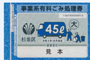
▲事業系有料ごみ処理券新券