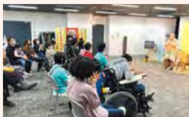
誰でも参加できる交流会の実施