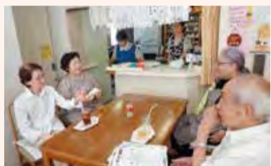
地域交流の場づくり