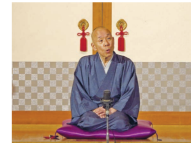
▲浅草演芸ホールでの寄席の様子

ずっと師匠の落語をどうにか自分のものにしようとしてきましたが、どうしたって形にできないものもある。やればやるほど情けなくなる。そういうものは捨てていくしかない。私はよく芸を身に付けるのに「吾なら生じたほうがいい、垢なら落としたほうがいい」という表現を使いますが、これは自分が付けてきたものが吾ではなく垢だったと気付いたら、洗い落として、そこに自分の吾だと思つてものを少しづつ生じていくしかないのです。