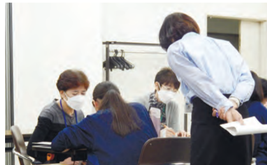
▲中高生のための無料学習・受験サポート事業