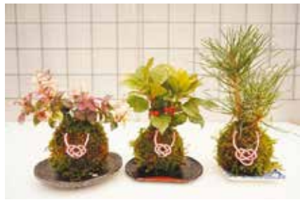
..... いずれも .....

◆コケ玉作り講習会 時 3月30日(土)午前10時～11時・午後1時～2時 対 小学生以上の方(小学生は保護者同伴) 定 各10組(申込順) 費 各1000円