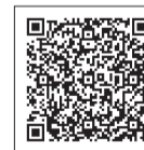
▲ひとり親家庭のしおり