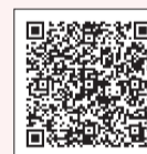
▲ひとり親家庭の相談

子ども家庭部管理課（区役所東棟3階）・福祉事務所では、相談員がひとり親家庭の悩み・困りごとの相談を受け、自立に向けた支援を実施しています。また、インターネットによる相談も受け付けています。詳細は、区ホームページをご覧ください。