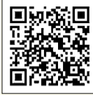
表1のとおり。詳細は、「防災用品あっせんのご案内」(防災課(区役所西棟6階)・区民事務所・地域区民センターなどで配布)や区ホームページ(右2次元コード)をご覧ください。また、同課に見本品を用意しています。