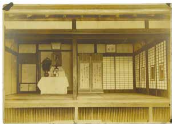
提供=佐藤維純/昭和10年ごろ撮影

JR荻窪駅南口から東へ徒歩3分のところに、格式ある長屋門と「明治天皇荻窪御小休所」と刻まれた石碑が残っています。かつてこの場所には、明治天皇が行幸時に利用した建物がありました。内部には明治天皇の立像が飾られ、「明治天皇御製」と書かれた掛け軸がかけられていました。 ※移築された御小休所は現在立ち入り禁止。