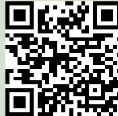
受講報告兼アンケート 二次元コード