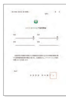
▲パートナーシップ届受理証