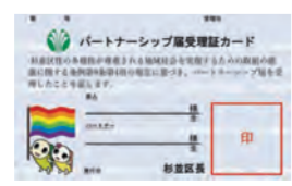
▲パートナーシップ届受理証カード